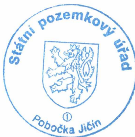
Ing. Jaromír Krejčí vedoucí Pobočky Jičín Státní pozemkový úřad Otisk úředního razítka

Předpokládání účastníci řízení budou písemně vyrozuměni o termínu konání úvodního jednání (§ 7 zákona). Na úvodním jednání budou účastníci seznámeni s účelem, formou a předpokládaným obvodem komplexních pozemkových úprav. Dále zde bude projednán postup při stanovení nároků vlastníků (ust. § 8 zákona), popřípadě další otázky významné pro řízení o pozemkových úpravách.